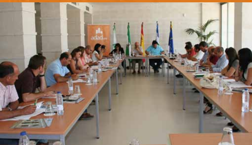
Consejo Territorial celebrado el 28 de julio en el Centro Guadiamar de ASAJA en Húévar del A.

En el apartado de proyectos promovidos por entidades sociales sin ánimo de lucro, destaca la variedad, interés y calidad de las propuestas que ya han sido registradas en la ventanilla de ADAD. Entre todas ellas, ya han sido ejecutadas actuaciones como las III Jornadas Internacionales de la Aceituna de Mesa, organizadas por la Fundación para el Fomento y Promoción de la Aceituna, y comenzará a ejecutarse en breve proyectos como el de la Fundación Andaluza de AMPAS, “Todos somos Escuela”, que pretende revitalizar el tejido asociativo de Madres y Padres de Alumnos y facilitar su implicación en la vida escolar .