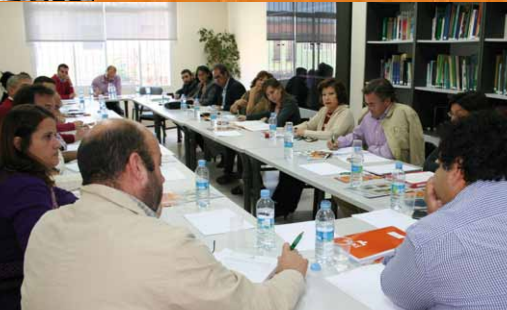
Imagen del Consejo Territorial de ADAD celebrado el 4 de noviembre en Pilas

El Consejo Territorial de ADAD ha aprobado desde el pasado mes de abril 28 proyectos, que con una subvención de 800.000 euros van a generar una inversión de alrededor de 2.000.000 de euros. Son iniciativas empresariales de creación y modernización de actividades, de administraciones públicas locales (como el Centro del Mosto de Umbrete o la Escuela de oficios tradicionales de Doñana de La Puebla del Río) y de asociaciones sin ánimo de lucro y el propio GDR que van a impulsar la dinamización, igualdad de oportunidades, sostenibilidad y gobernanza social.