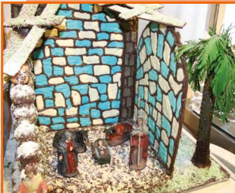
Portal de Belén elaborado en chocolate para estas fiestas navideñas