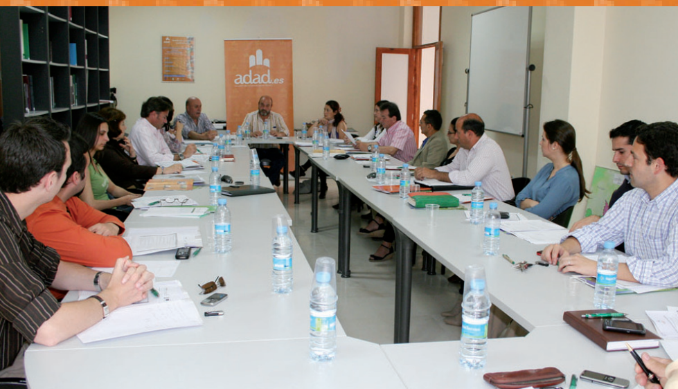
Consejo Territorial del 29 de abril celebrado en la sede de ADAD en Pilas

En definitiva, con los primeros fondos del programa “LiderA” adjudicados por ADAD se procederá a la creación de 3 nuevas empresas, una que realizará trabajos de ingeniería y servicios de consultoría y asistencia técnica a empresarios, particulares e instituciones en Almensilla; una segunda dedicada al pupilaje y doma de caballos, formación y turismo ecuestre en Bollullos de la Mitación; y una tercera en Isla Mayor, municipio en el que se va a montar una clínica veterinaria. Estos tres nuevos proyectos tienen en común que son iniciativas de jóvenes y que ofrecen servicios deficitarios en la comarca.