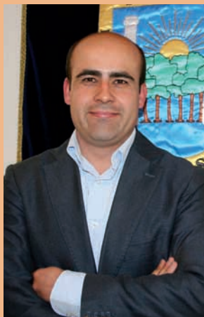
RAÚL CASTILLA ALCALDE DE SANLÚCAR LA MAYOR

Sanlúcar la Mayor. En mayo se celebraba la última sesión local de presentación del PAG en Sanlúcar, donde se registraba un alto índice de participación y expectación. En el acto, presidido por el alcalde, se explicaron las principales líneas de actuación y el procedimiento de gestión del programa y se atendía multitud de dudas de los participantes.